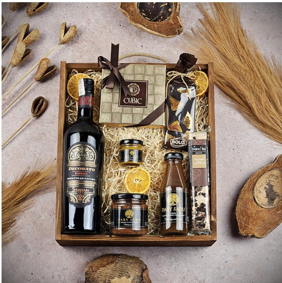
Przykładowa wizualizacja produktu. Zestaw wysyłany jest w zamkniętej skrzyni / kartonie.